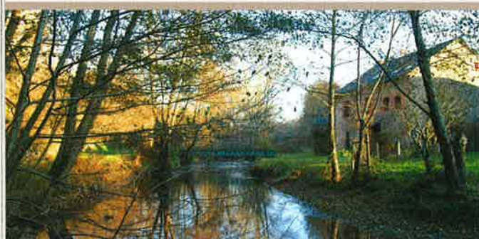
LE MOULIN CHANTELOUBE

de la rivière ont aussi actionné les mécanismes des forges pour battre le fer. Créées aux environs de 1640, les forges d'Abloux, utilisant le bois et le minerai extrait localement, ont fait la richesse du village pendant les deux siècles et demi durant lesquels elles ont fonctionné. Autour de 1800, elles occupaient directement 250 ouvriers et presque autant d'employés, mineurs, charbonniers, muletiers, etc. La production atteignait alors 300 tonnes de fonte et 200 de fer forgé expédiées vers Limoges et Guéret.