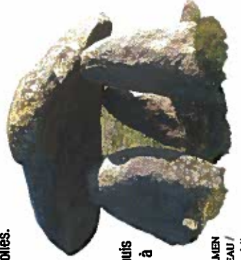
LE DOLMEN DE PASSEBONNEAU

7 Descendre par la rue à droite après une scierie. À la dernière maison, obliquer à droite sur la piste, franchir une dernière fois l'Anglin, puis remonter jusqu'à la route et à l'étang en reprenant en sens inverse l'itinéraire de l'aller.